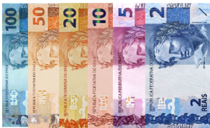
Figura 1: Dinheiro sem valor usado no jogo.