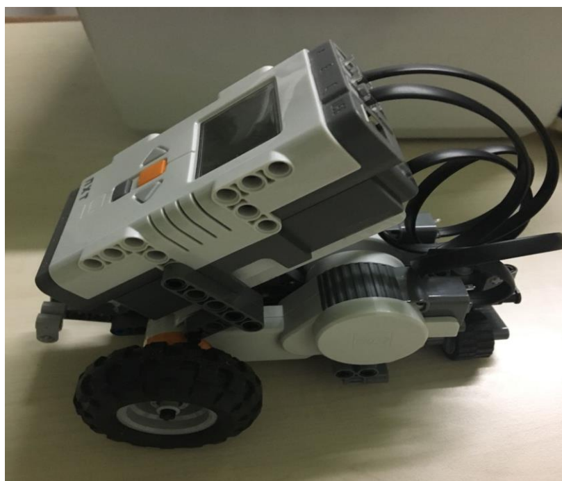
Figura 4- CARRO - ROBÔ EDUCADOR