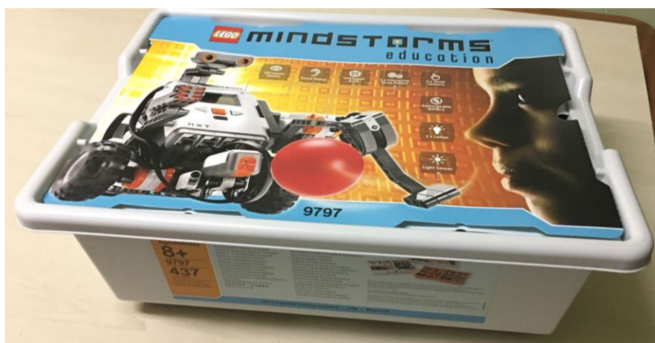
Figura 1- KIT LEGO

A Figura 1 apresenta a maleta que compõe um dos kit's LEGO com o qual será desenvolvido o trabalho.