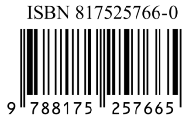
Figura 5. Código de barras

Exemplo: Mostrar que o código ISBN abaixo é válido.