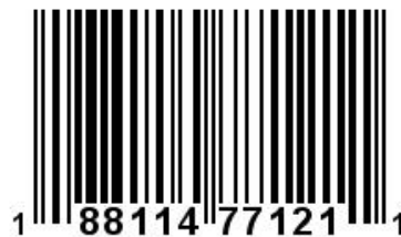
Figura 2. Código de Barras

Exemplo: Mostrar que o código de barras abaixo é válido.