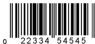
Figura 3. Código de Barras

Exemplo: Calcular o dígito verificador d que torna o código de barras abaixo válido.