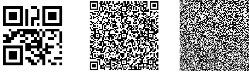
Figura 2: Fonte: https://en.wikipedia.org/wiki/QR_code#head

Existem 40 versões de QR Codes , de diversos tamanhos, que diferem entre si na quantidade de informação armazenada. A versão de 177 \times 177 módulos é a versão atual com maior capacidade de armazenamento: 7089 caracteres numéricos, 4296 alfanuméricos, 2953 binários/byte e 1817 kanji/kana.