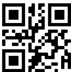
Figura 1: QR Code gerado pelo site: https://br.qr-code-generator.com

As informações em um QR Code são armazenadas em blocos, formando um mosaico como na figura abaixo: