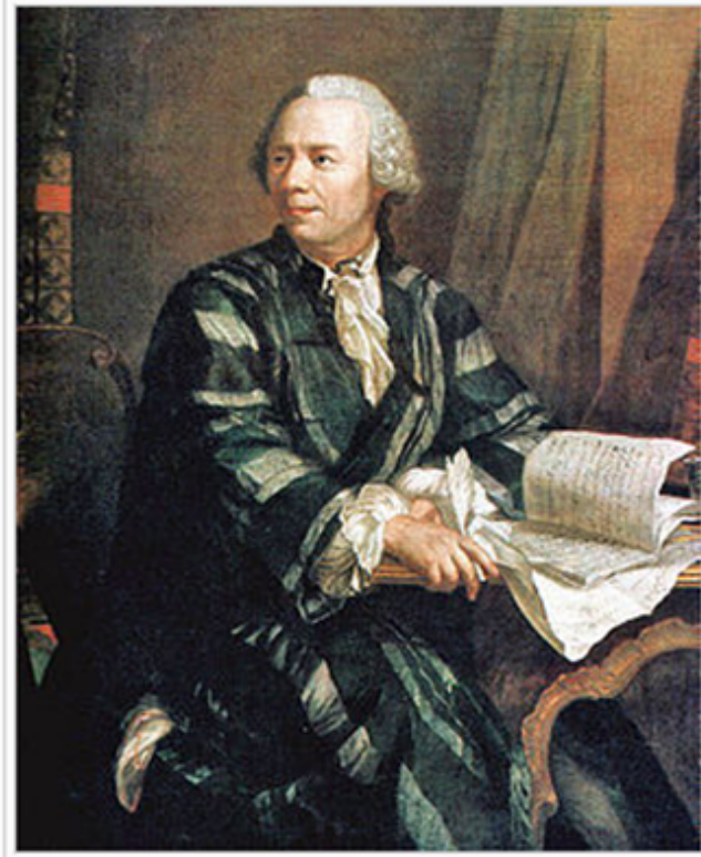
Figura 1.1: Leonhard Euler